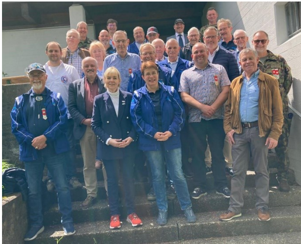
Die Teilnehmer der ZHSV-Rundfahrt.

Resultate erzielt wurden und eine gute Stimmung in den Schützenhäusern herrschte.